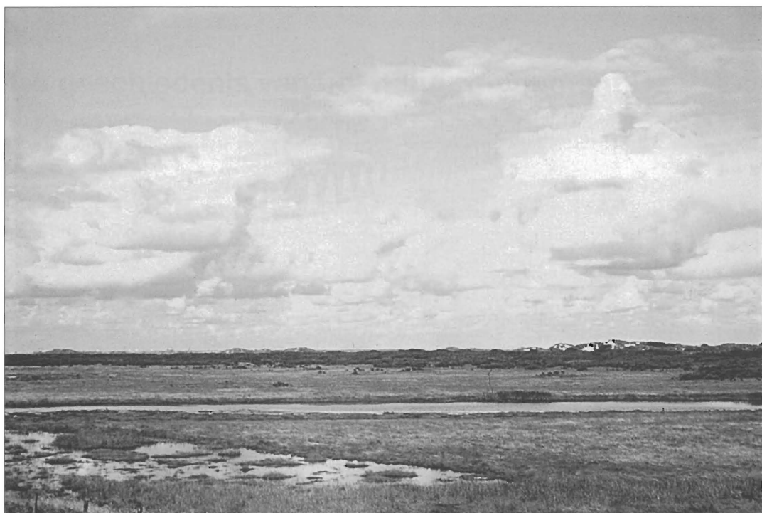
Rust en ruimte bepaalden het landschap op De Beer.