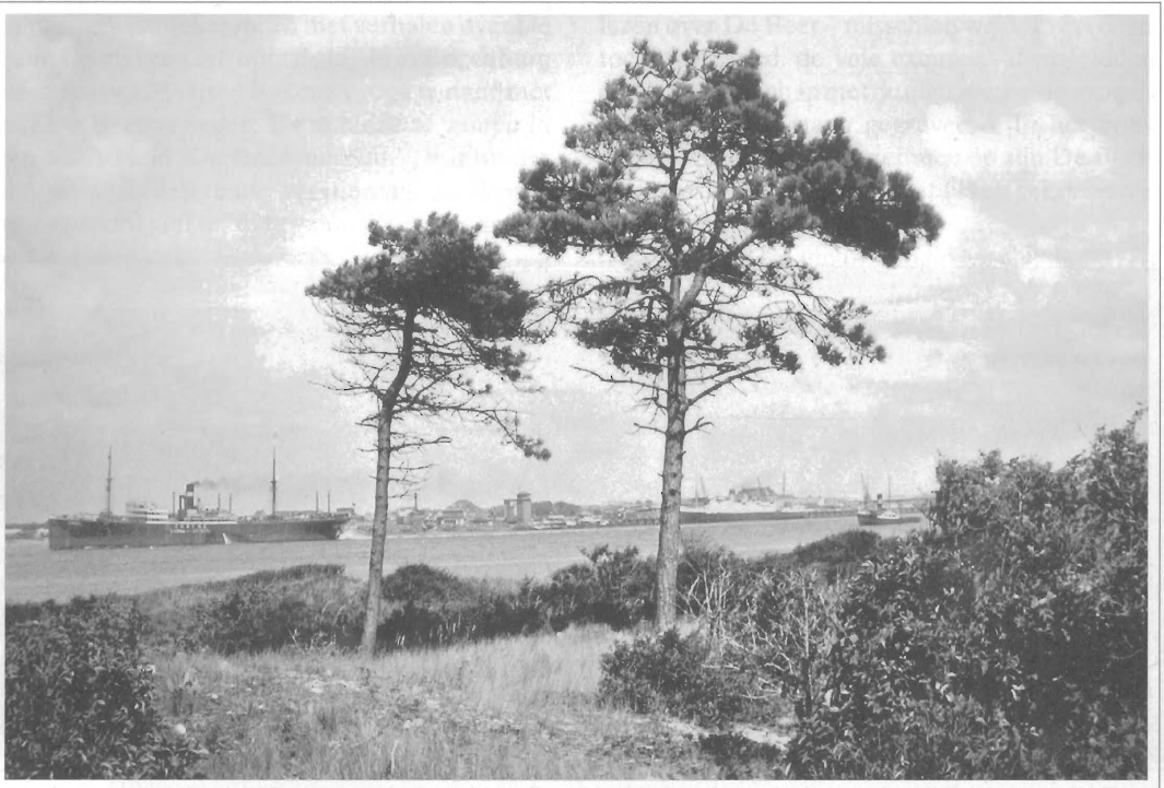
Zicht op Hoek van Holland vanaf De Beer. Rechts aan de kade, een van de schepen van de Batavierlijn, die op Harwich-Engeland voer.