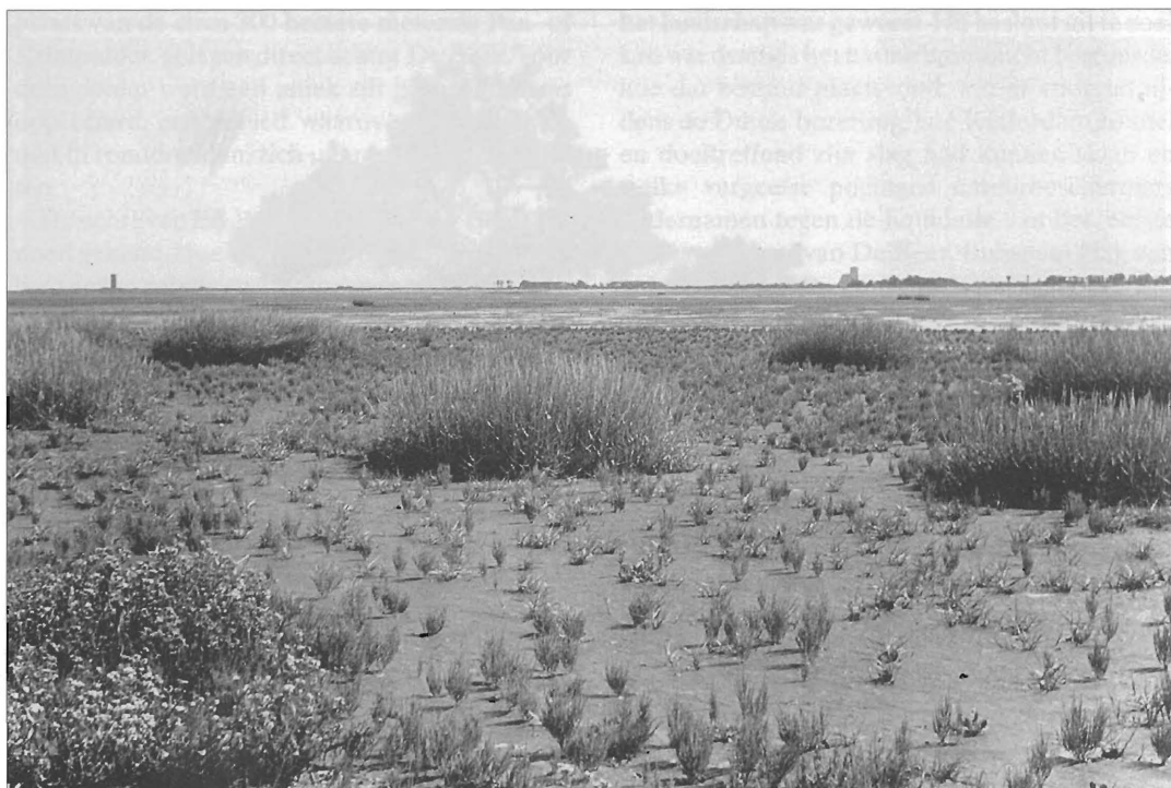
Het Zuidelijk van De Beer aan de monding van de Brielse Maas. Recht vooruit de toren van Brielle, links daarvan de wassertoren. Tegenwoordig vanaf de Maasvlakte naar het zuiden kijkend, domineren beide nog steeds het landschap van Voorne.