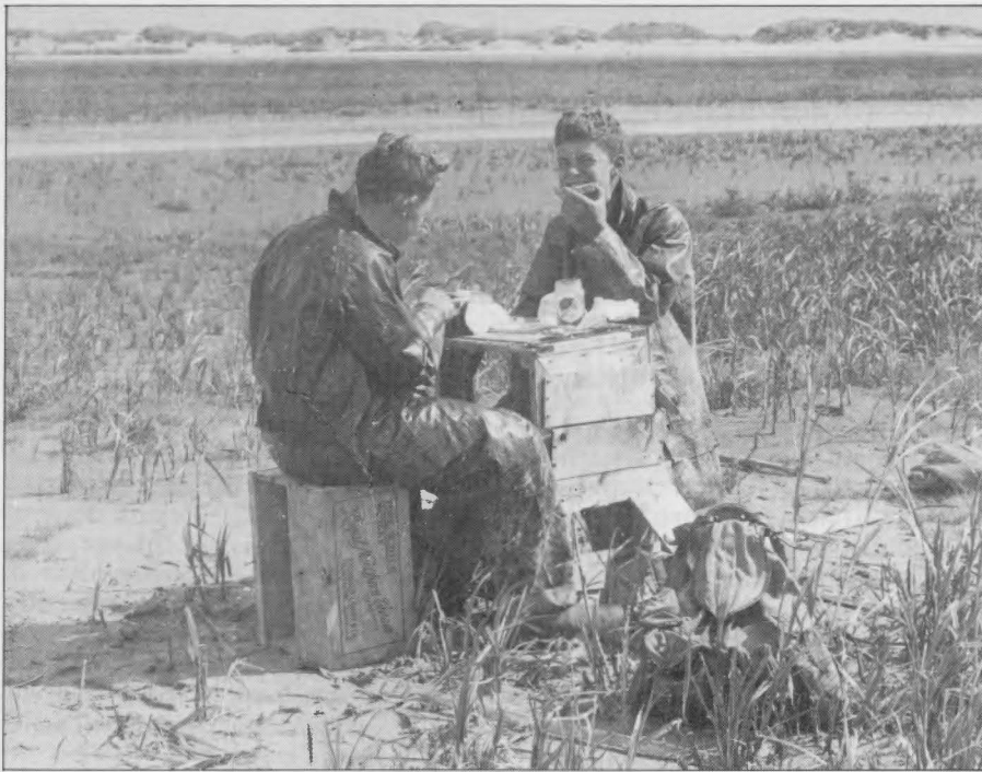
Lunch op De Beer, ca. 1930