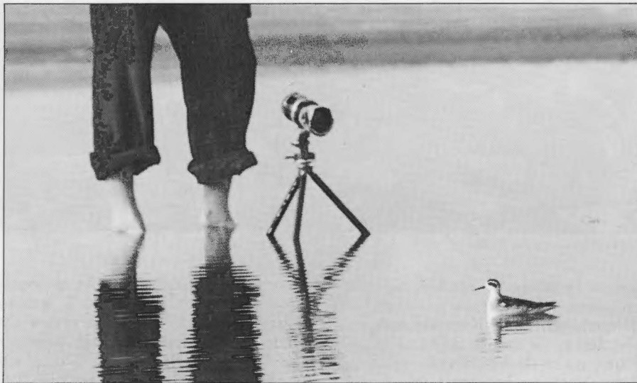
Fotograferen van een Grauwe Franjepoot