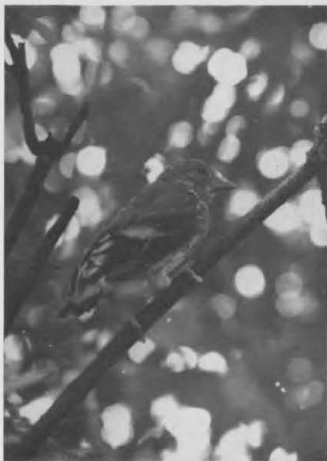
Jonge putter builen het nest

De putter is een uitstekende klimmer, zit graag in de toppen van bomen, doch heeft echter nergens lang rust.