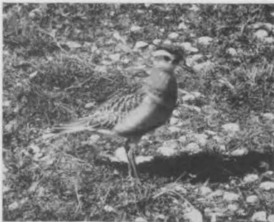
Morinelplevier op het groene strand van het vogeleiland „De Beer”.

Na het leggen van de eieren houden de wijfjes zich