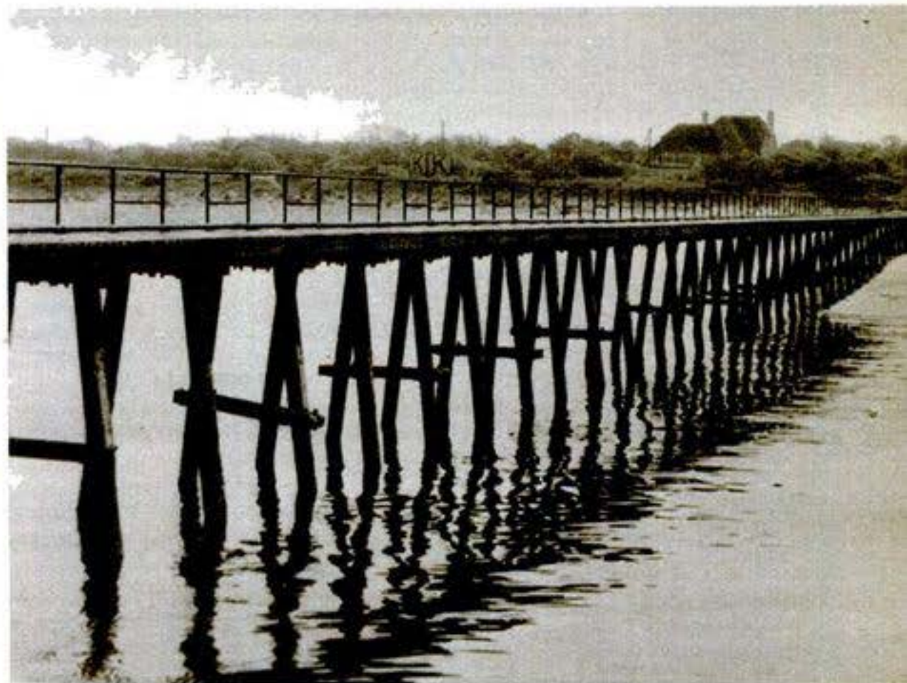
De entree tot de Beer. Nog een paar jaar?