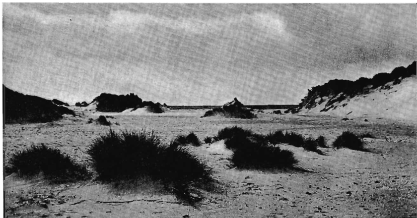
In de stuifduinen, op de achtergrond het groene strand

bloemtuilen, zorgen ze voor een onuitwisbare indruk van de ontzaglijke weelde, die het kenmerk is van de zomer, in de herfst, als de takken doorbuigen onder een vrucht van zwart-violetten bessen, zijn ze niet minder belangrijk, want dan trekken ze geweldige massa's vogels aan, duizenden, ja, tienduizenden spreuwen, die gulzig komen snoepen van de rijke bessenovervloed. Begrijpelijk, dat de vlieren een voorname plaats in de film innemen! Even begrijpelijk is het, dat niet alle planten, die karakteristiek zijn voor een bepaalde omgeving, opgenomen kunnen worden. Soms zijn ze te klein, soms is de bloeiwijze te nietig of te kleurloos om het in de film „te doen“. Ik denk bijvoorbeeld aan de flora van de schorren, aan al dat kleine goed als spiesbladmelde, klein schorrenkruid, zilte schijnsparrie, enz., enz., dat met elkaar, door het oog van de camera gezien, slechts een egaalkleurige massa vormt en zo heb ik van de schorren alleen de prachtig bloeiende lamsoren en de door zijn lichte tint naar voren springende zeealsem als representanten gekozen. En wat later ook de zeeasters, die in volle bloei zo'n prachtige omlijsting van de vele schilderachtige krekten vormden.