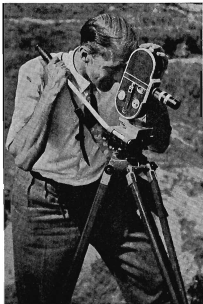
... bij het opnemen van de flora

Het was in alle opzichten een bijzondere dag. Ik herinner het me nog goed: het was één van die zeldzaam heerlijke zomerdagen, waarop je je meer dan ooit gelukkig prijst te leven, een dag, waarop je het dubbel en dwars waardeert er eens uit te kunnen breken, actetas en portefeuille te verwisselen voor kijker en camera en toe te geven aan die verlangens, welke nog hun oorsprong hebben in het verre verleden van de mensheid, verlangens, opgewekt door de zwerf- en jachtinstincten, die we als een erfenis van onze praehistorische voorouders nog in ons omdragen. Al te vaak immers moeten we, gebonden door allerlei maatschappelijke plichten, deze innerlijke roep naar de natuur het zwijgen opleggen!