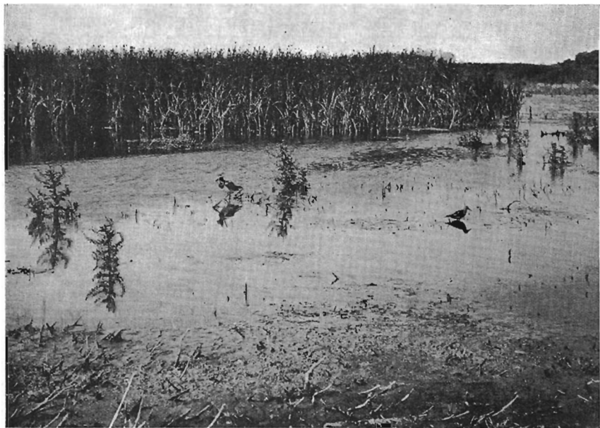
Kievit en oeverloper aan de Kievitvplas; op de achtergrond een eilandje begroeid met zeebies

kwamen nu aan alle kanten konijntjes te voorschijn gehuppeld. Fazanten kraaiden in de duinbosjes en sommige waagden zich reeds buiten de dekking van het duindoornstruweel. Zilvermeeuwen, met kalme wiekslag aanvliegend uit de richting van het wad, streken neer op het talud van de Dijk, waar reeds vele, ouden en jongen, in afwachting van de schemering en de nacht, in rusthouding bijeen groeften. Ergens langs een van de ondiepe plaatsen aan de rand van de vlakte riep een wiggatje lang en nadrukkelijk. Met het zwijgen van de vogel viel een intense stilte in. Zelden werd ik zo getroffen door de rustige, vredige sfeer, die buiten in de vrije natuur heerst bij het scheiden van de dag.