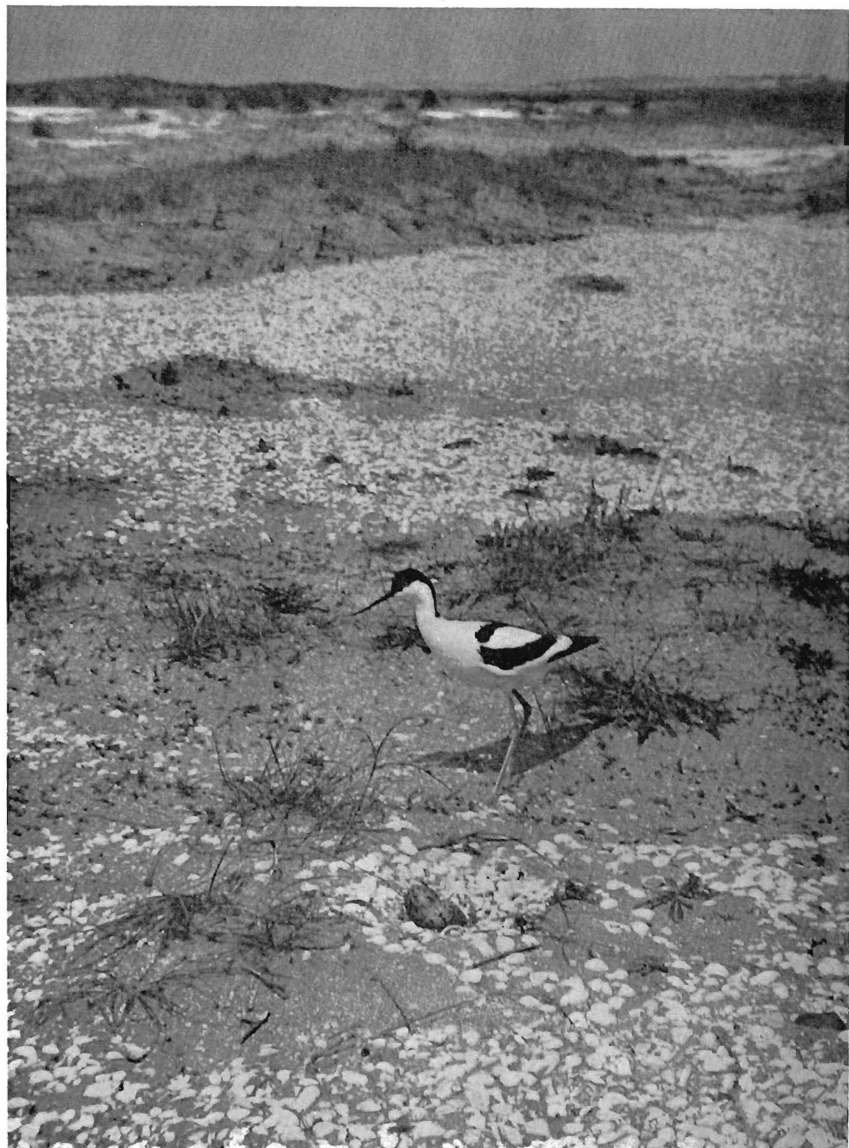
Kluut bij zijn nest op een schelpvlakte aan de zuidkant van de Beer